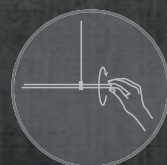
360° rasterlos drehbar